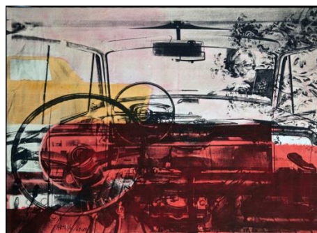
Mimmo Rotella – Posso, 1963-1965