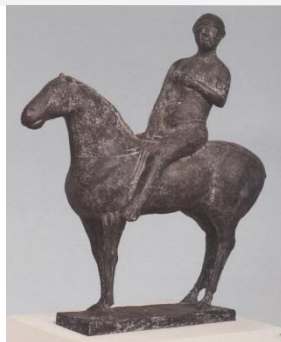
Marino Marini – Cavaliere, 1945. Bronzo, 105x100x36cm