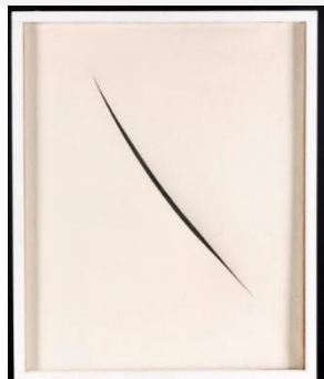
Lucio Fontana – Concetto Spaziale, Attesa, 1960

Tra le iniziative in programma, alla chiesa protestante di St.Moritz si terrà una mostra con opere di Lucio Fontana e Piero Manzoni , per un dialogo tra le due figure più importanti dell'arte italiana del Dopoguerra. Dai grandi maestri dell'informale si passa ad altre importanti stagioni che hanno contrassegnato la scena italiana: con la retrospettiva su Aldo Mondino allestita nella galleria Robilant e Voena e con la personale di Salvo alla chiesa Francese.