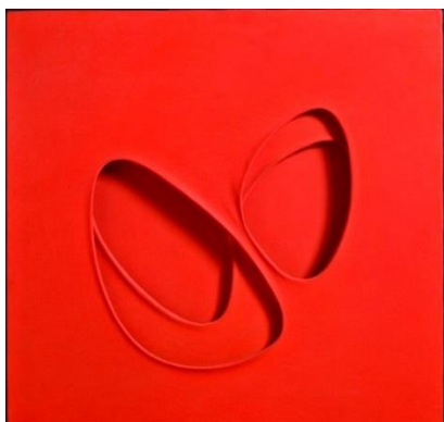
Paolo Scheggi – Intersuperficie curva dal rosso, 1964 – Acrilico rosso su tre tele sovrapposte, 90x90x6.5cm

In arrivo St.Moritz Art Masters 2015 : dal 21 agosto al 30 agosto 2015, mostre, workshop, incontri, lecture e molto altro testimonieranno quanto la storia creativa italiana abbia influenzato l'ambito culturale europeo e mondiale per tutto il '900, dalla rivoluzione industriale al periodo tra le due guerre mondiali, dal boom economico all'affermazione del Made in Italy .