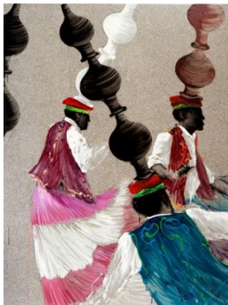
Aldo Mondino – La danse des Jares, 1997. Olio su linoleum, 240x140cm

Non sarà dimenticato l'importante apporto del fashion system con la personale che al Kempinsky omaggia Giovanni Gastel , tra i più grandi fotografi di moda al mondo. Per l'occasione posto a confronto con l'artista italiano che più di ogni altro ha saputo giocare con l'immaginario dello show-business e con la seduzione esercitata dai grandi divi del cinema: Mimmo Rotella .