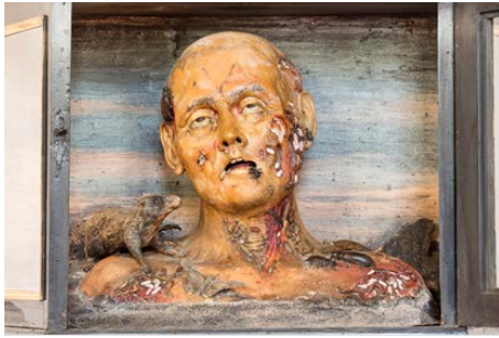
Longari arte Milano (stand 159) Gaetano Giulio Zumbo (Siracusa 1656-1701 Paris) Anatomical bust with worms Polychrome waxwork in a black-lacquered wooden case with gold leaf 62 x 68.5 x 27 cm Circa 1699-1700

La lista completa degli espositori è disponibile on line: www.tefaf.com .