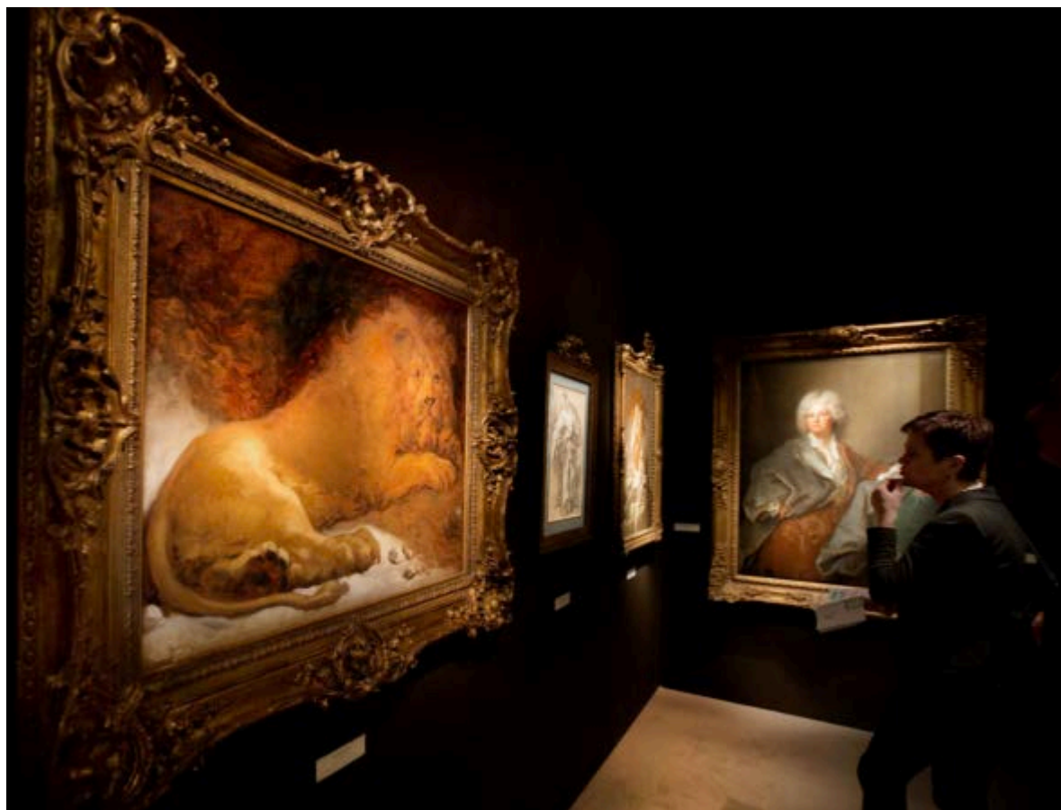
Galerie Eric Coatelem at TEFAF 2015

TEFAF Maastricht inaugura oggi, 10 marzo, per i VIP. Mentre apre al pubblico domani, venerdì 11 marzo, come di consueto al MEEC che quest'anno ospiterà circa 270 espositori, tra mercanti d'arte e d'antiquariato leader di settore, provenienti da 20 Paesi. TEFAF è considerata la fiera più importante al mondo e un appuntamento imprescindibile per i maggiori collezionisti privati e istituzionali internazionali.