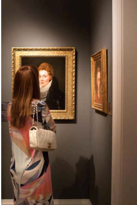
TEFAF 2015

In realtà i dati non sono completi, perchè in media ha risposto solo il 14% dei rivenditori. Ma rimane comunque l'informazione più completa disponibile al momento. Si vedrà se le vendite in fiera porteranno dei buoni risultati, dopo un inizio 2016 un po' timido che ha visto un calo dei risultati delle prime aste di febbraio da Christie's e Sotheby's a Londra.