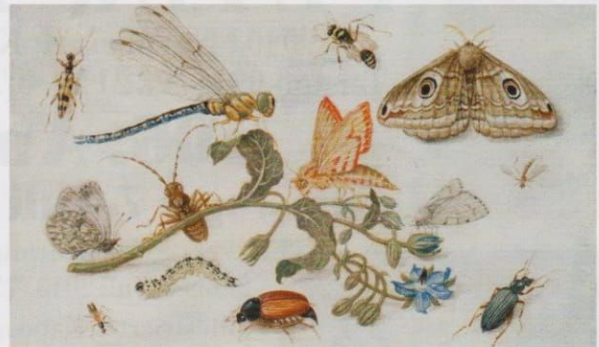
Jan van Kessel d. Ä., Insektenstudie 1660, Caretto & Occhinegro bei der London Art Week

Das Museum Wilhelm Busch erschließt die Bestände durch